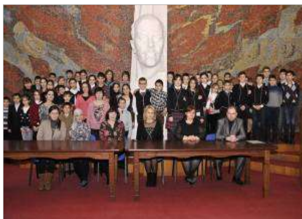
Республиканский турнир «Интеллект - 2014»