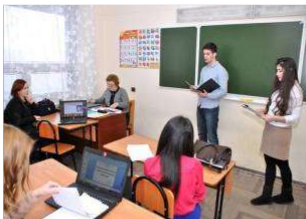
XXIV Республиканская конференция учащихся НОУ «Сигма»

За многолетний период в РДТДМ воспитаны лауреаты, дипломанты, победители международных, всероссийских, республиканских, городских турниров, конференций, конкурсов, олимпиад..., что свидетельствует о результативности труда педагогов НИО.