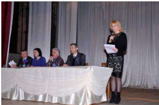
XVII Республиканская научная конференция школьников «Чтения памяти В.И. Вернадского»

Гордостью Дворца является Научное общество обучающихся. Это важнейшее направление работы Дворца, обеспечивающее развитие исследовательского творчества учащихся не только города, но и республики.