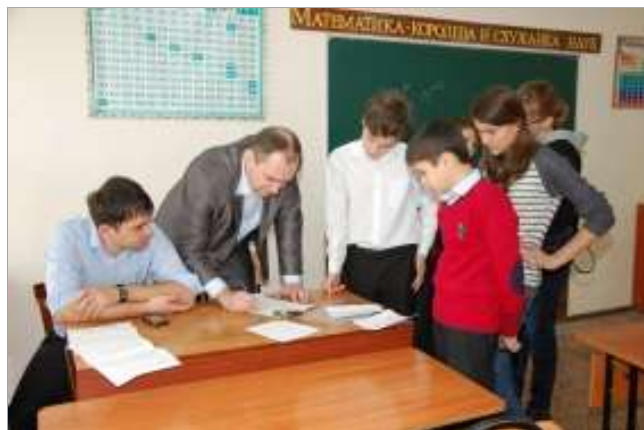
Городской этап турнира «Интеллект – 2014»

За многолетний период в РДТДМ воспитаны лауреаты, дипломанты, победители международных, всероссийских, республиканских, городских турниров, конференций, конкурсов, олимпиад..., что свидетельствует о результативности труда педагогов НИО.