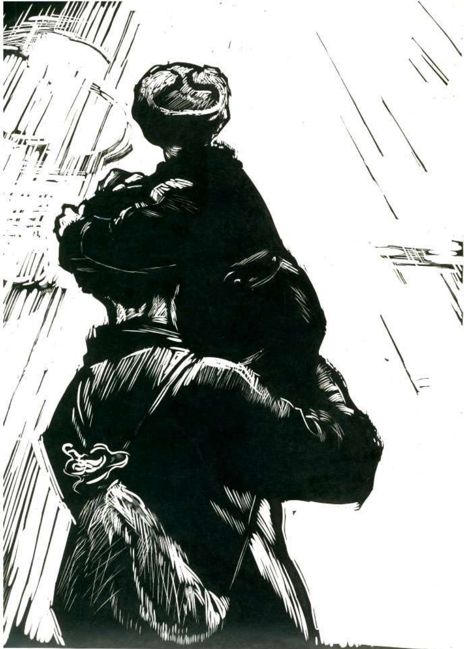
© 2014 by the artist. All rights reserved. [Faint handwritten text]